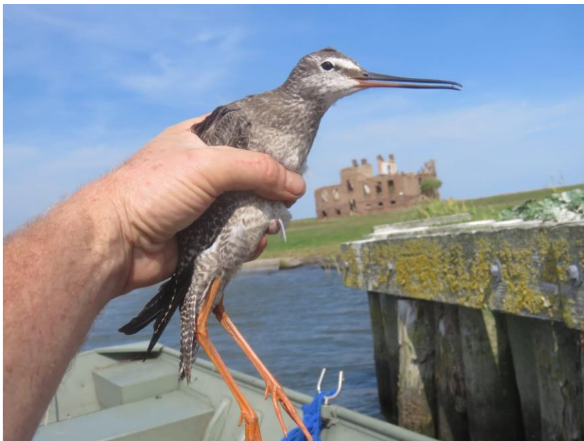
Beringter Dunkler Wasserläufer