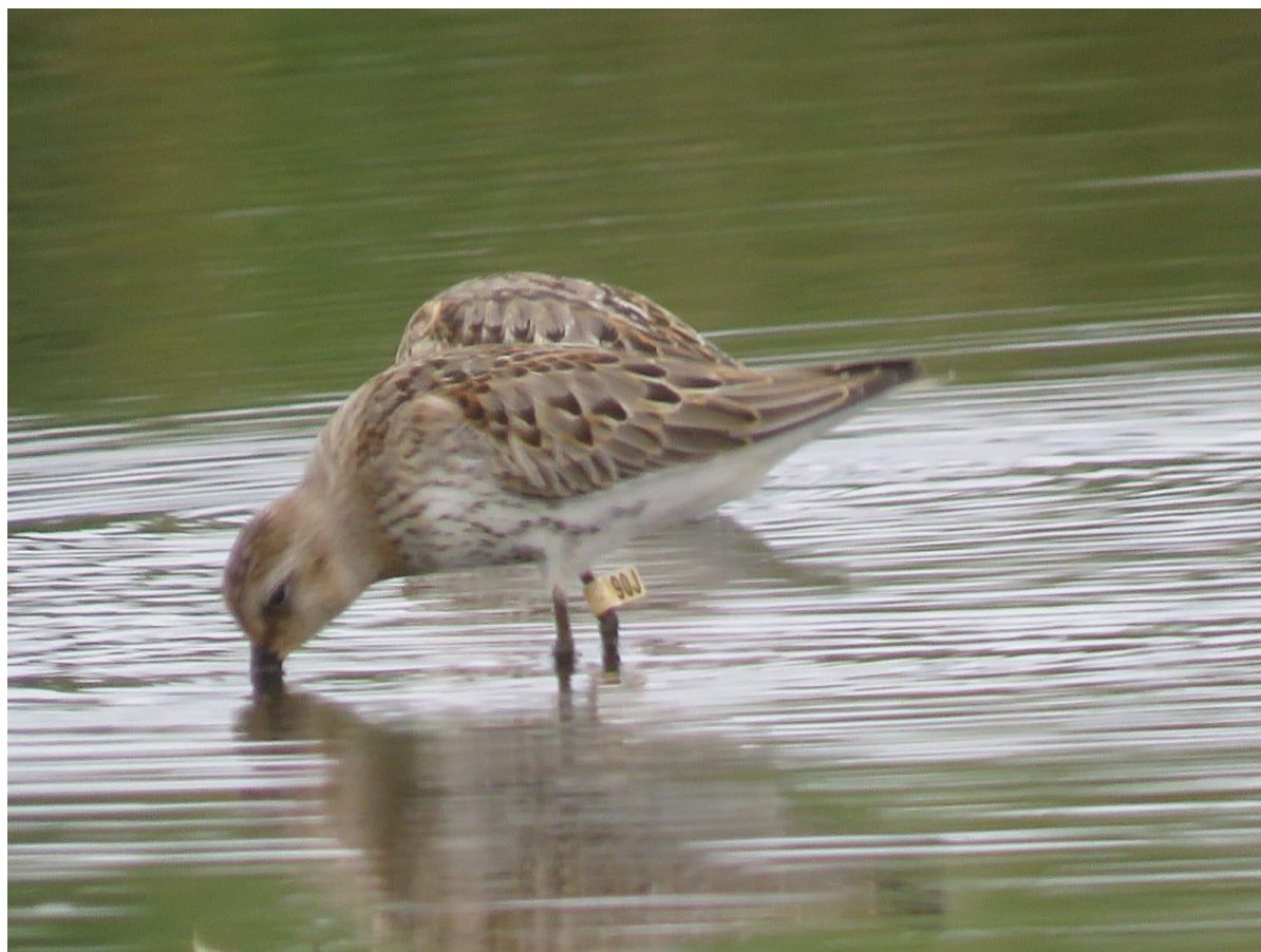
Farbberingter Alpenstrandläufer 90J weiß

Im Herbst 2021 wurden auf dem Riether Werder 33 Alpenstrandläufer mit Hilfe einer Chinesischen Aalreue gefangen und mit einem Ring der Beringungszentrale Hiddensee markiert.