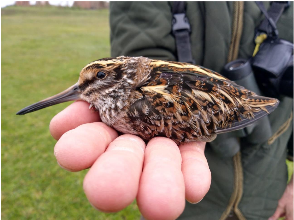
Zwergschnepfe nach der Beringung auf dem Riether Werder Oktober 2021

Zusammengestellt und bearbeitet von Frank Joisten