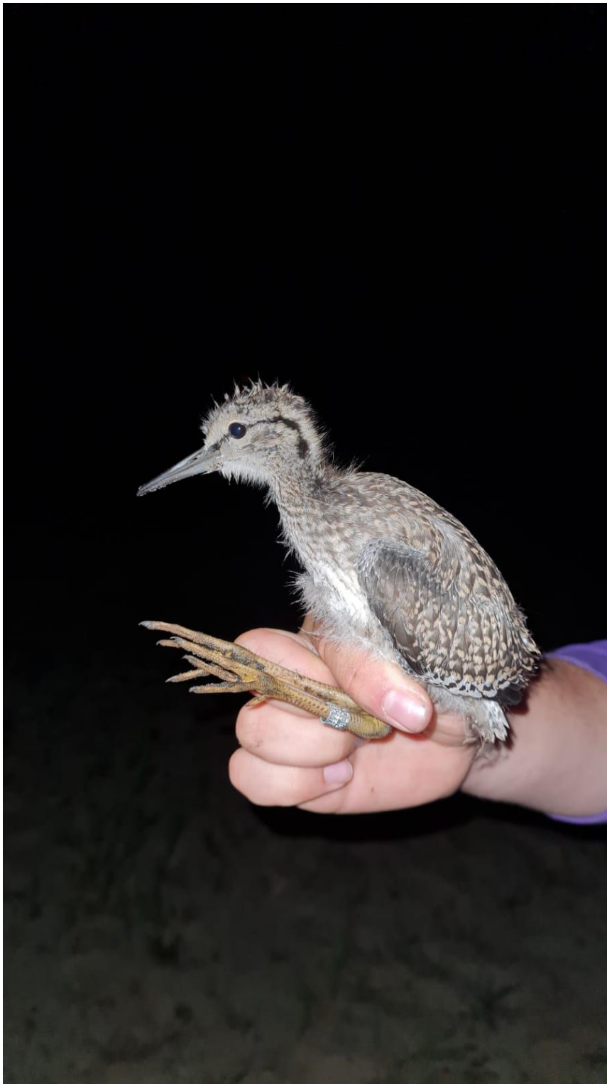
Mit Hilfe des Wärmebildgerätes bei Nacht beringter Rotschenkeljungvogel