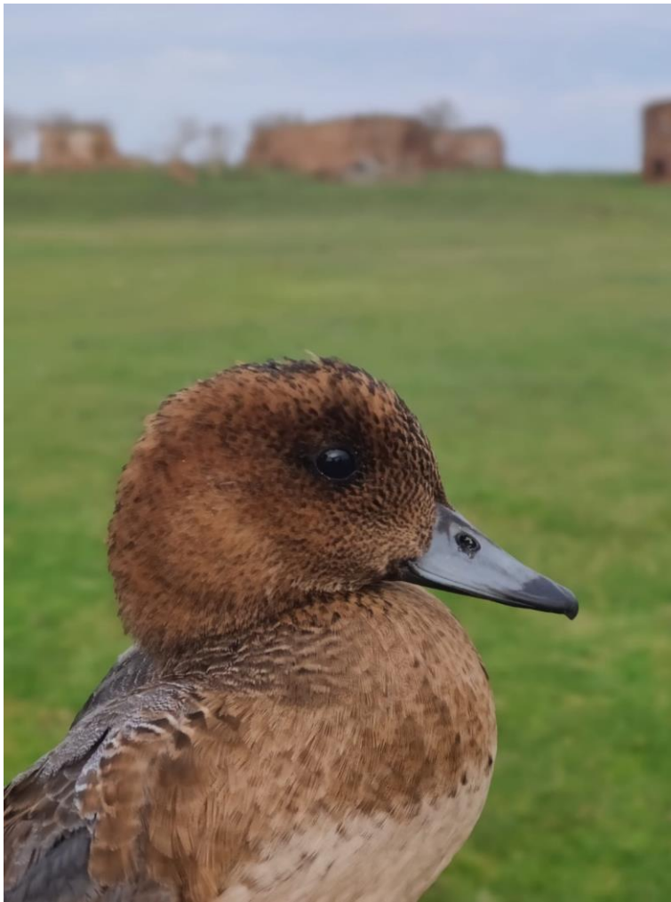
Gefangen und beringte Pfeifente