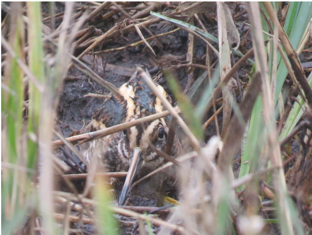
Mit Hilfe der Wärmebildkamera entdeckte Zwergschnepfe