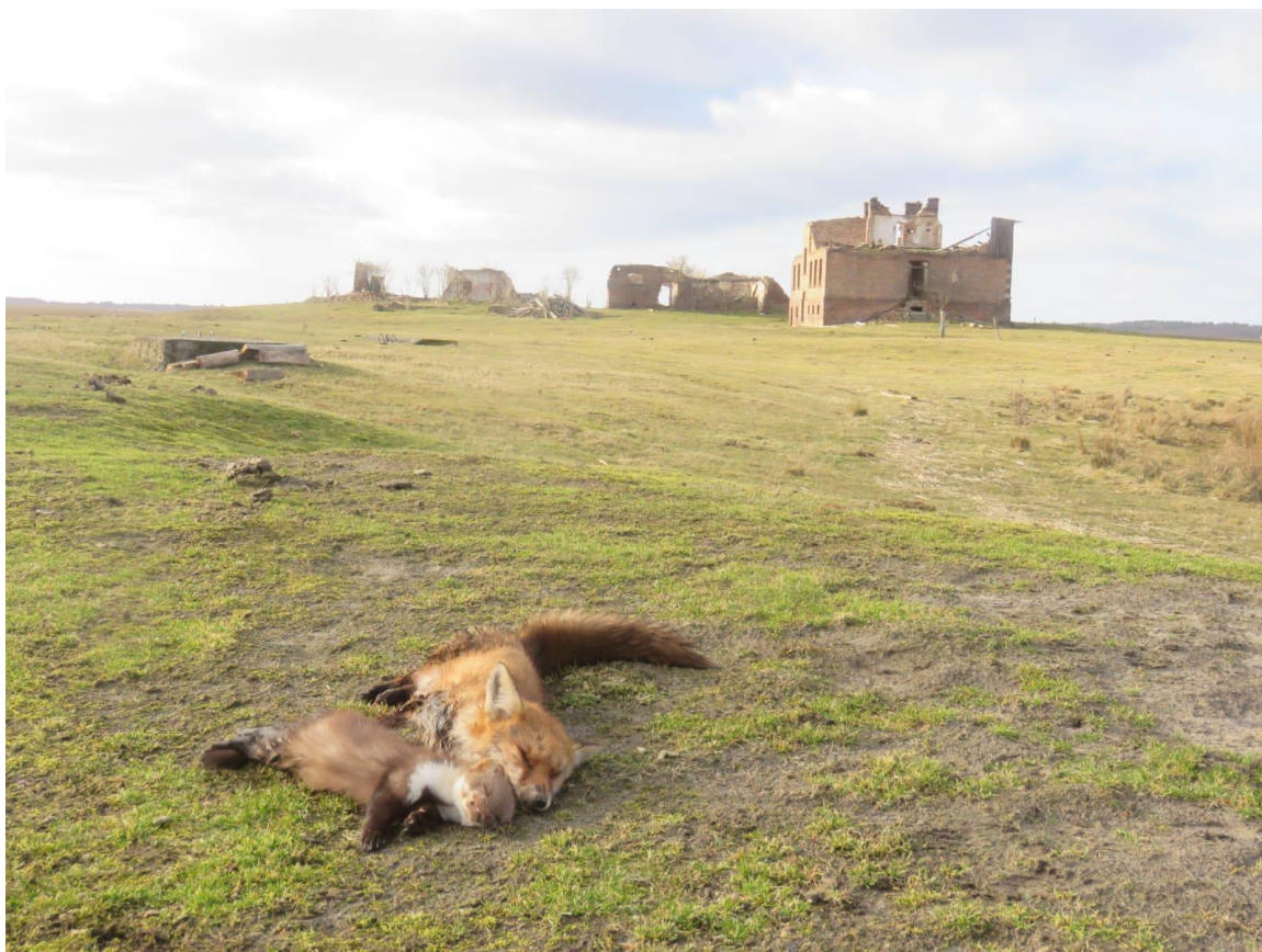
Im Frühjahr 2021 auf der Insel erlegte Fuchsfähe und Steinmarder

Prädation gab es darüber hinaus in der Lachmöwenkolonie wieder durch das Erbeuten kleiner Küken durch Rot- und Schwarzmilan. Die Kolonie nahm diese beiden Arten in ihrem Jagdverhalten nicht ernst.