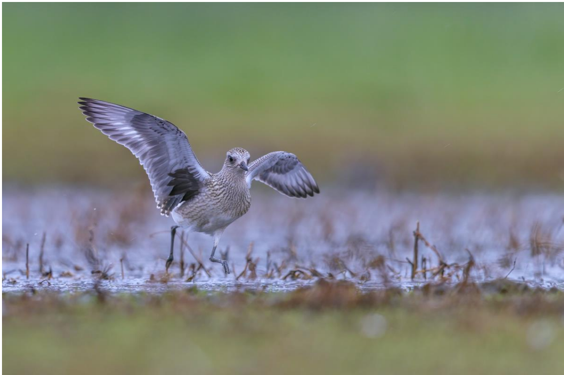
Kiebitzregenpfeifer mit dem charakteristischen schwarzen Achselfleck