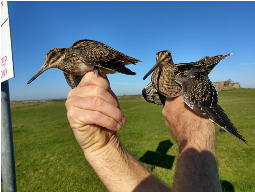
Gefangene Zwergschnepfe und Bekassine